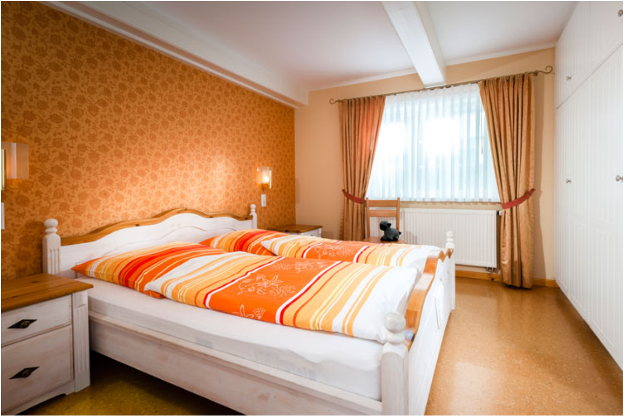
• Schlafzimmer II