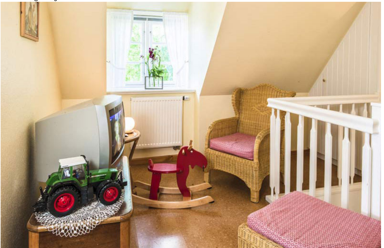
• Schlafzimmer I