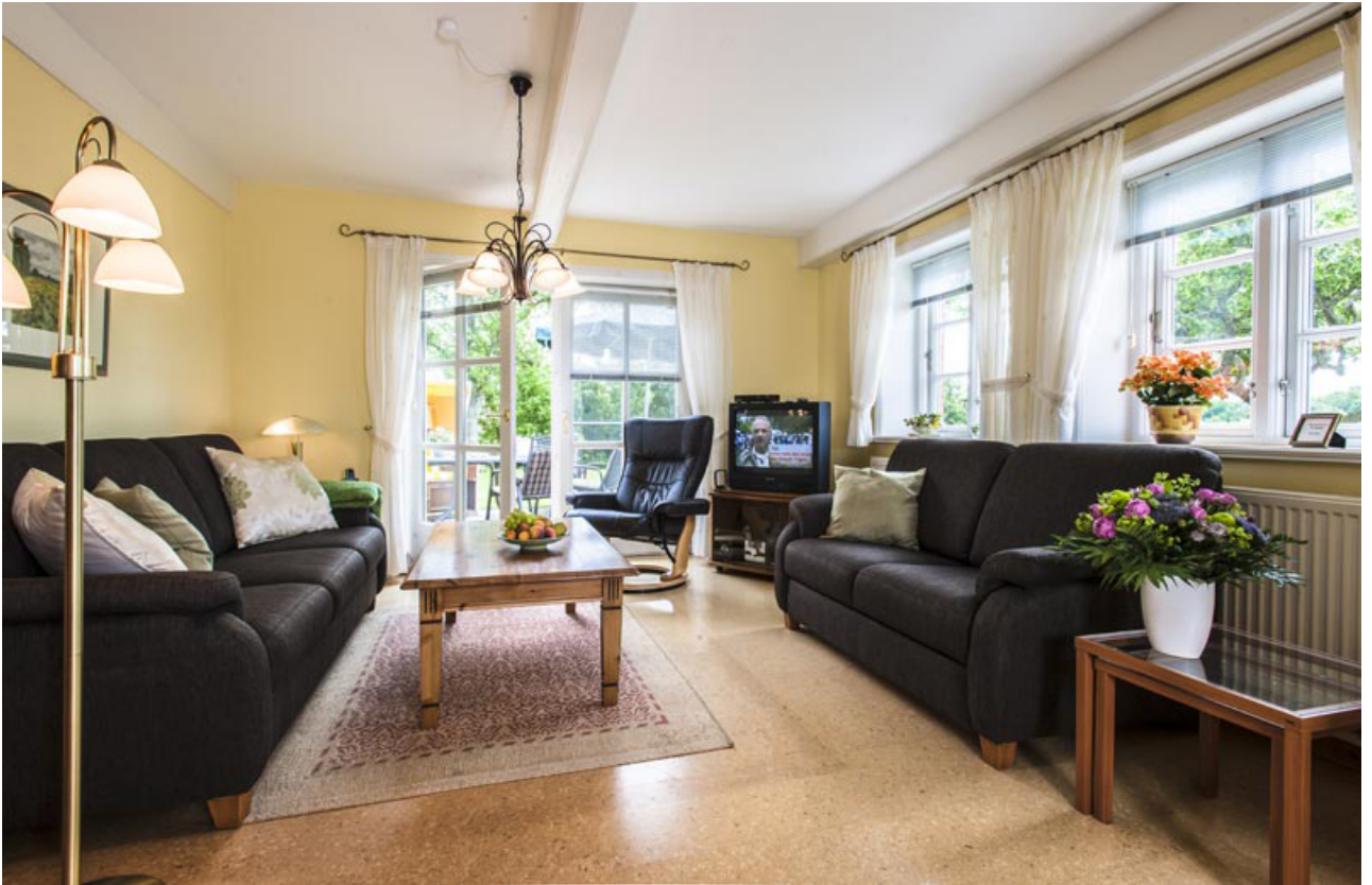
• Wohnung Antje