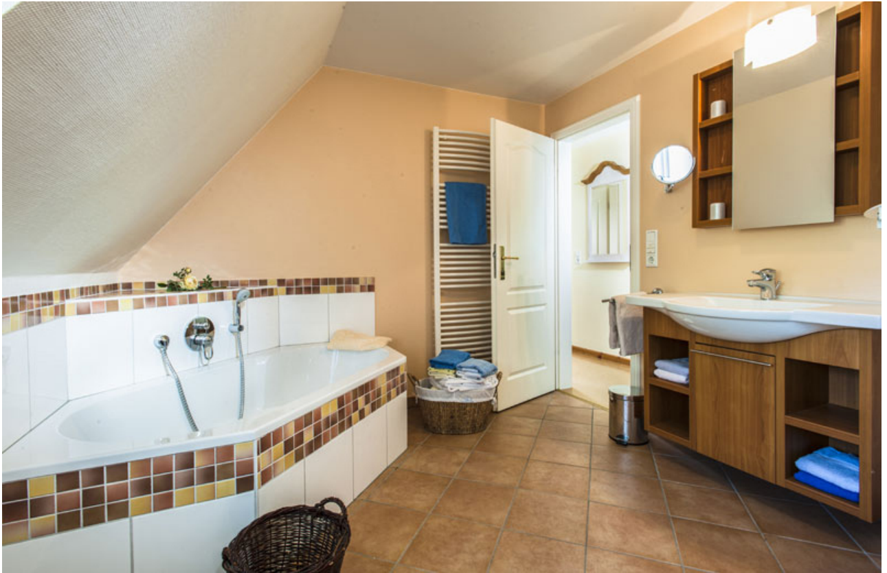
Großzügiges Dusch- und Wellnessbad mit Dampfsauna (für 2 Pers.) und Badewanne. Eine helle, wohnliche Küche mit Backofen, Mikrowelle und Spülmaschine. Wohnung Antje befindet sich am südlichen Ende des restaurierten Bauernhauses unter Reet.